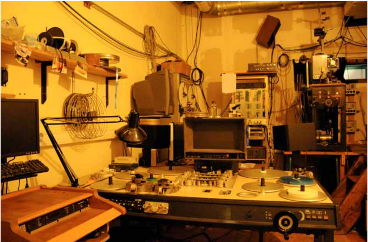
La salle de montage argentique 16mm et la cabine de projection.