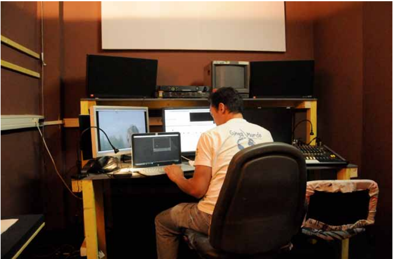
Les deux salles de montage numérique, équipée en Macintosh, logiciels de montage Final Cut, Première, Protools. La première des salles est aujourd'hui équipée d'un double poste montage son-image, mis en place lors de la postproduction du long métrage A & C une histoire d'Abel et Caïn , un film de Raphaëlle Paupert-Borne, monté début 2017.