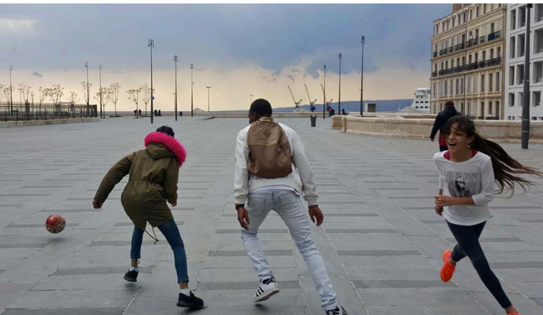
Repérages pour Massaboom! Esplanade de la Major, Marseille, 2017