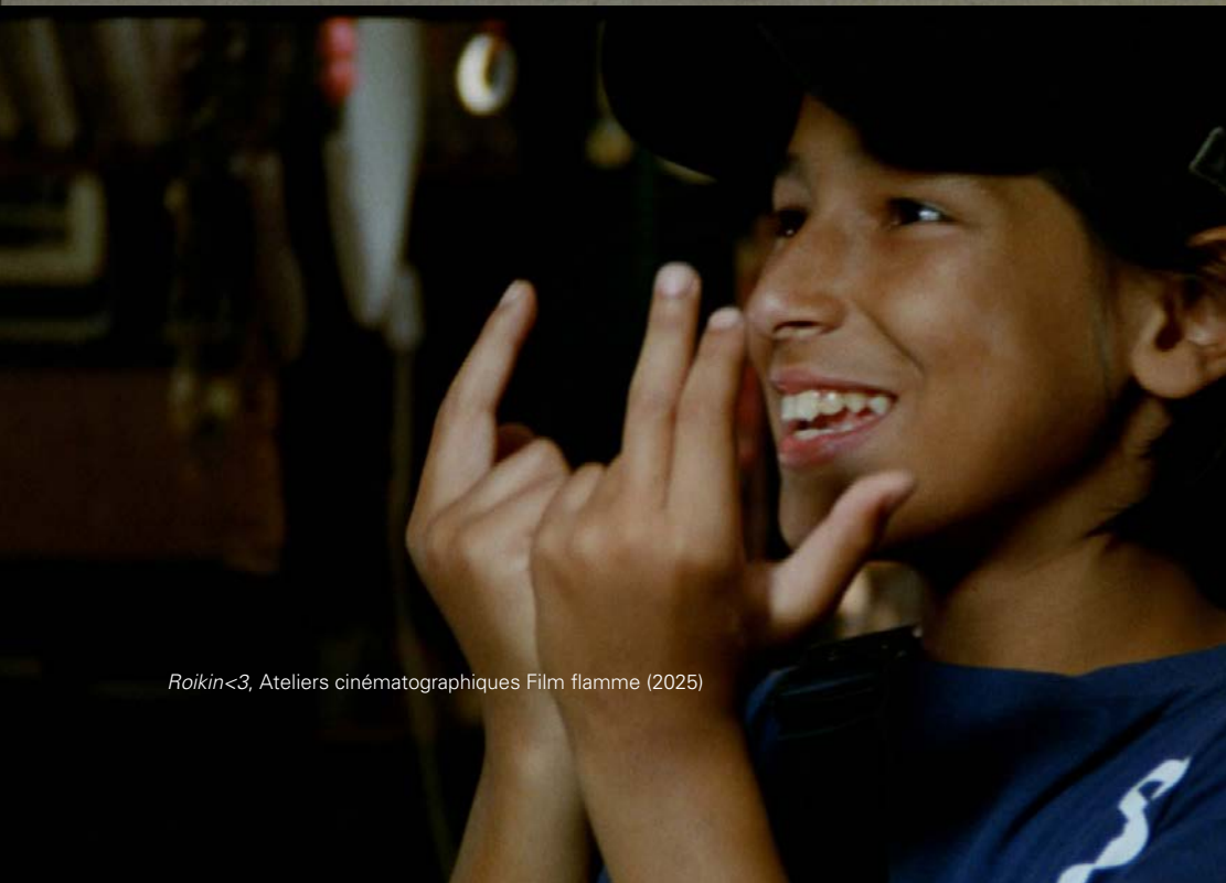
Roikin<3, Ateliers cinématographiques Film flamme (2025)