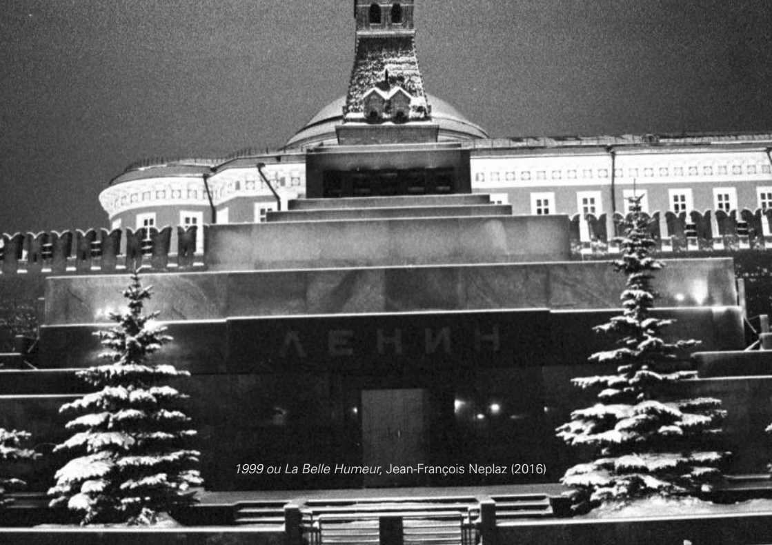
1999 ou La Belle Humeur, Jean-François Neplaz (2016)