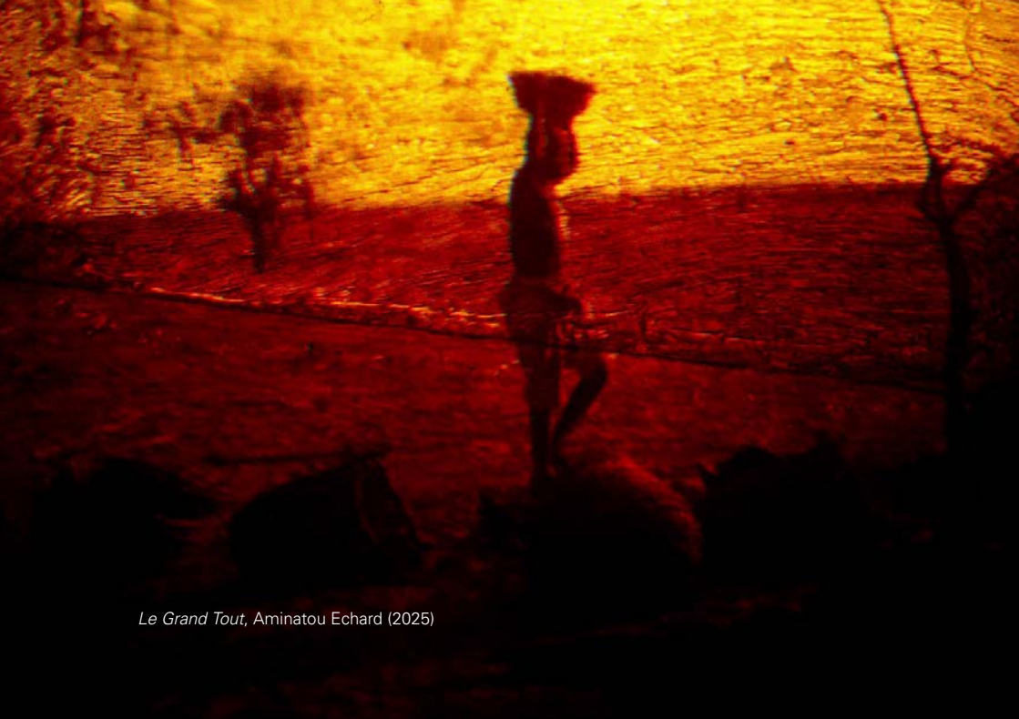
Le Grand Tout, Aminatou Echard (2025)