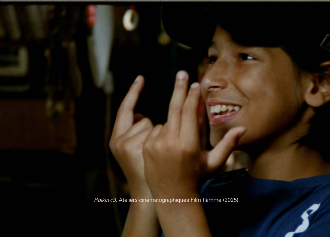
Roikin<3, Ateliers cinématographiques Film flamme (2025)