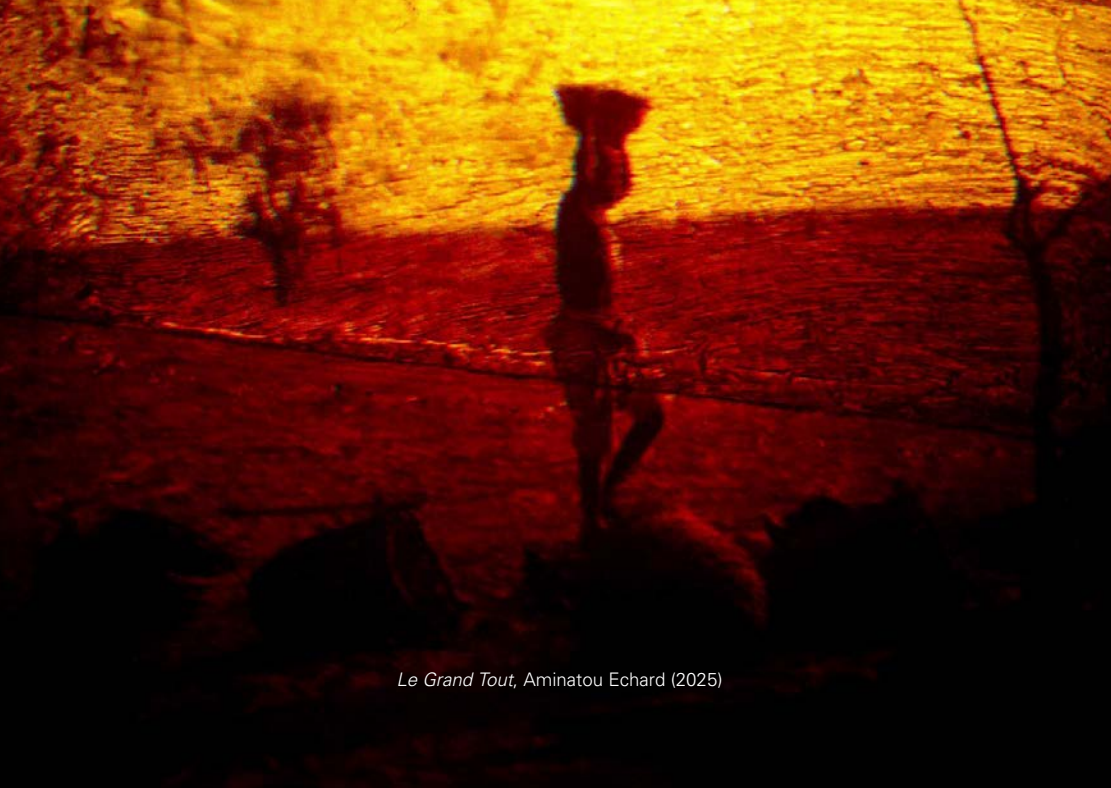
Le Grand Tout, Aminatou Echard (2025)