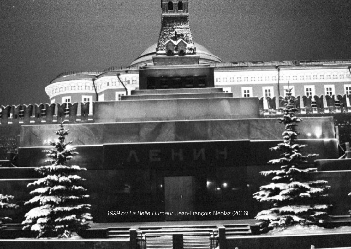
1999 ou La Belle Humeur, Jean-François Neplaz (2016)